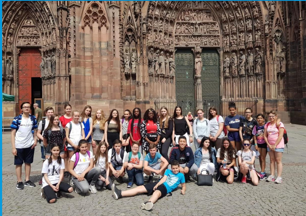
Die Jahrgänge 7 und 8 vor Notre Dame in Straßburg (2019)

VIELEN DANK FÜR IHR ZUSCHAUEN UND INTERESSE!